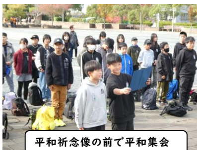
平和祈念像の前で平和集会

運動会でも素晴らしい頑張りを見せてくれた6年生でしたが、この修学旅行での姿も素晴らしいものでした。早いもので、卒業まであと3か月。これからも、日新小のリーダーとして頑張ってくれることでしょう。卒業式でのさらに成長した姿が楽しみです。