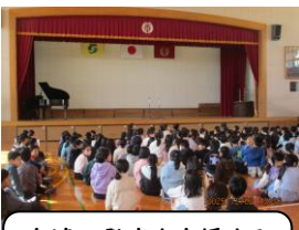
友達の発表を応援する 子ども達

12月2日(火)と4日(木)の昼休み、集会委員会が企画し、『きらり集会』が開催されました。『きらり集会』というのは、自分が好きなこと、得意なこと、頑張っていることをみんなに披露する場です。個人でも、チームでもOK。もちろん、強制ではなく、応募する人はもちろん、見る人も参加自由です。今年は、8組、13人の応募があり、歌、ダンス、ピアノ、ギター、漫才、O×クイズと大盛り上がりでした。披露した子ども達の勇氣には感心させられます。また、下の写真からもわかるように、自由参加にもかかわらず多くの子ども達が見学し、手拍子で応援したり、拍手を送ったりする姿もとても素敵でした。自分たちで企画し、運営し、また、それにみんなも協力する、そんな日新小の子ども達の姿に幸せな時間を過ごさせてもらいました。