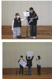
勇氣ある発表に 拍手!!