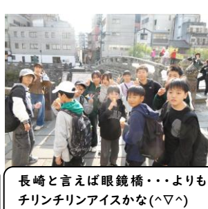
長崎と言えば眼鏡橋……よりもチリンチリンアイスかな(へ▽へ)