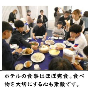
ホテルの食事はほぼ完食。食べ物大切にすることも素敵です。